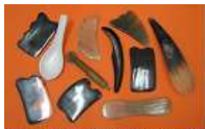
A collection of instruments used for gua sha treatment. The black tools are made of polished buffalo horn, which makes superior instruments. This is because buffalo horn in traditional Chinese medicine has a cold property and is therefore effective in dispelling heat factors from the body.

کشیدن این سنگها باید متناسب با وضعیت فیزیکی بیمار و در مسیر مریدینها صورت پذیرد. و پس از آن موضع را پاک کرده و بیمار مرخص می شود.